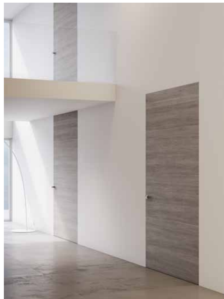
ALBA | PORTA A BATTENTE | Finitura impiallacciata | maniglia tradizionale

Offriamo una capillare e organizzata rete di squadre di posatori specializzati, presente su tutto il territorio nazionale, che operano con competenza e professionalità per garantire le migliori prestazioni estetiche, funzionali e di durabilità dei prodotti.