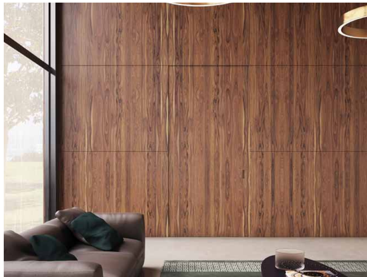
MAREA | SCORREVOLE A SCOMPARSA | Versione manuale | Finitura legno naturale | Sistema boiserie in continuità parete-pannello

Dietro al nostro lavoro si nasconde una storia tutta italiana fatta di design e grande esperienza. L' elevato know how mascherato dall' apparente semplicità della porta filo muro, insieme all' altissimo grado di "customizzazione" dei progetti, permette di soddisfare anche i più esigenti desideri estetici e funzionali.